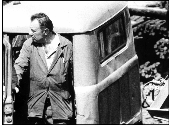
Image : Vladimir Bashta Son : Alexandr Zakrevsky Montage : Sergueï Loznitsa, Marat Magambetov et Margarita Smirnova Distribution : Pop Tuttu

La vie quotidienne en milieu rural, quelque part en Russie... Chronique d'une terre bucolique où les hommes et les bêtes partagent un même territoire.