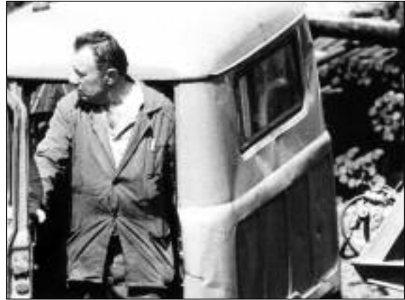
Image : Vladimir Bashta Son : Alexandr Zakrevsky Montage : Sergueï Loznitsa, Marat Magambetov et Margarita Smirnova Distribution : Pop Tuttu

La vie quotidienne en milieu rural, quelque part en Russie... Chronique d'une terre bucolique où les hommes et les bêtes partagent un même territoire.