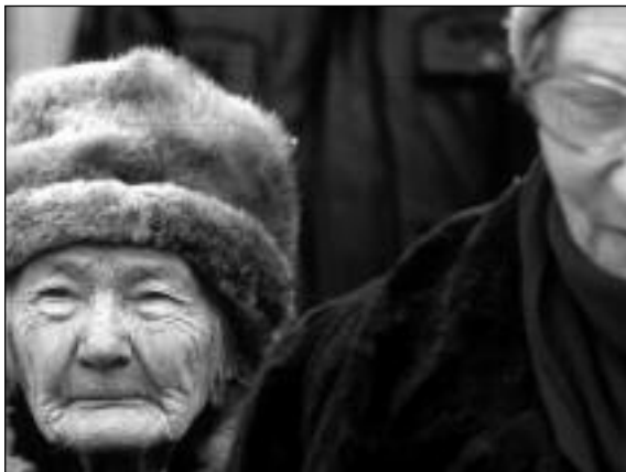
Image : Pavel Kostomarov Son : Valerij Petriashvilli Montage : Sergueï Loznitsa Production : St. Petersburg Documentary Film Studio Distribution : Deckert Distribution

Un village russe. Les habitants posent avec leur chien, dans leur jardin, devant leur maison... dans la plus parfaite immobilité. Portrait d'une communauté paysanne à travers les saisons dans ses gestes les plus simples.