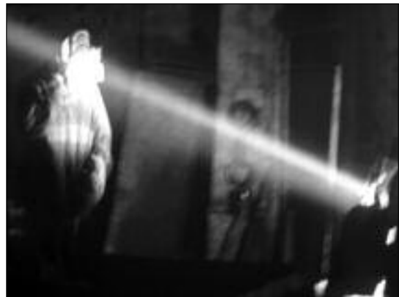
Image : Pavel Kostomarov Son : Vladimir Golovnitsky Montage : Sergueï Loznitsa Production : MA.JA.DE.Filmproduktion Distribution : Deckert Distribution

L'hiver. Un arrêt d'autobus dans un bourg de Russie. Les gens attendent le car. Visages dans le froid, bribes de dialogue, fragments de conversations sont embrassés dans un unique mouvement de caméra.