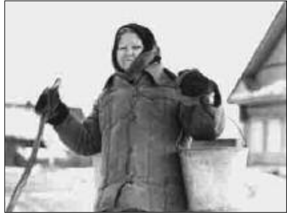
Image : Pavel Kostomarov Son : Valerij Petriashvilli Montage : Sergueï Loznitsa Production : St. Petersburg Documentary Film Studio Distribution : Deckert Distribution

Les habitants de la colonie vivent dans une grande maison à l'écart du village. Ils s'intègrent par le travail à la vie des paysans.