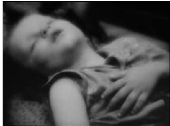
Image : Vladimir Bashta Son : Alexander Zakrevsky Montage : Sergueï Loznitsa et Marat Magambetov Production : Alexander Rafalovsky Distribution : Deckert Distribution

Un jour passé à observer le travail des ouvriers sur un chantier de construction à Moscou. Des situations drôles et cocasses ponctuent le quotidien des ouvriers.