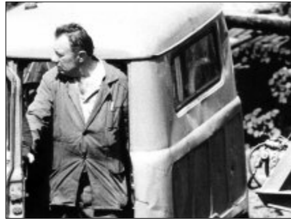
Image : Vladimir Bashta Son : Alexandr Zakrevsky Montage : Sergueï Loznitsa, Marat Magambetov et Margarita Smirnova Distribution : Pop Tuttu

La vie quotidienne en milieu rural, quelque part en Russie... Chronique d'une terre bucolique où les hommes et les bêtes partagent un même territoire.