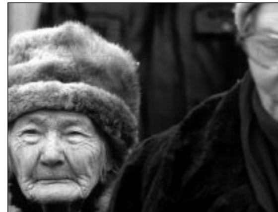
Image : Pavel Kostomarov Son : Valerij Petriashvili Montage : Sergueï Loznitsa Production : St. Petersburg Documentary Film Studio Distribution : Deckert Distribution

Un village russe. Les habitants posent avec leur chien, dans leur jardin, devant leur maison... dans la plus parfaite immobilité. Portrait d'une communauté paysanne à travers les saisons dans ses gestes les plus simples.